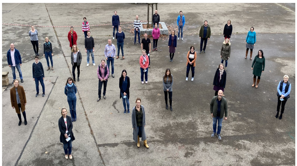
Das Kollegium (...Corona-bedingt leider nur ein Teil vom Kollegium)