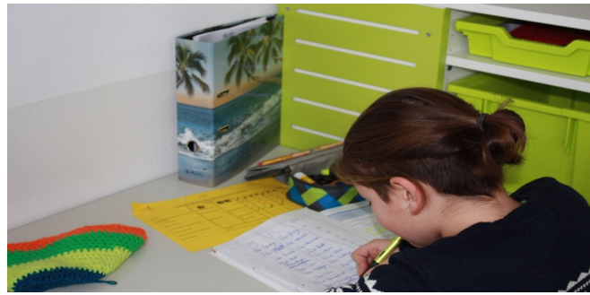
Lernen in der Lerninsel

Die Realschule erhält zusätzliche Stunden zur individuellen Förderung der Schüler und Schülerinnen. In diesen, für unsere Schulprofil wichtigen Lerninselstunden in den Kernfächern Mathe, Deutsch und Englisch, wird in kleinen Gruppen individuell geübt und gelernt.