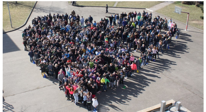
Schüler auf dem Pausenhof

Die Schüler kommen aus Giengen, Burgberg, Hohenmemmingen/Sachsenhausen, Hürben, Herbrechtingen, Hermaringen, Syrgenstein/Bachtal und aus sonstigen Gemeinden.