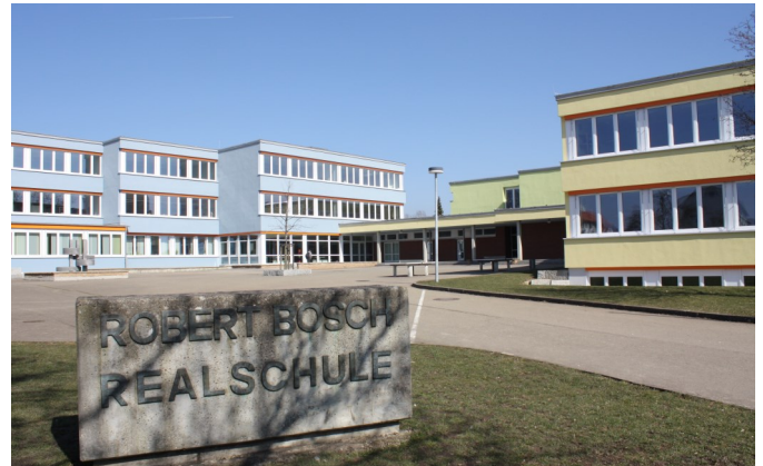
Die Robert-Bosch-Realschule Giengen

Weitere Informationen und Videos befinden sich auf unserer Homepage www.rea-giengen.de .