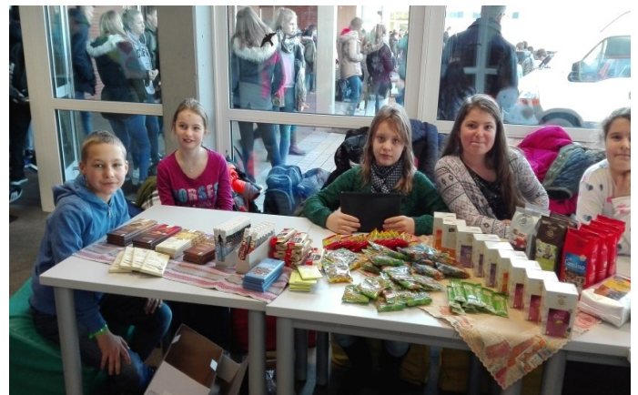
Hier sieht man die breite Auswahl an Produkten

Eifrige Verkäufer aus unserem Fairtrade-Team haben am Mittwoch, 22.11.17, wieder Waren aus dem Weltladen angeboten. Da gab es nicht nur leckere Schokoladen, Mango-Monkeys und so manch andere Süßigkeiten, Tee und Kaffee, sondern auch Armbänder, Ringe und viele verschiedene weihnachtliche Kleinigkeiten. Und das Beste: egal für was man sich entschieden hat, immer konnte man sicher sein, dass man mit dem Kauf was Gutes getan hat!