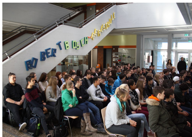
Schülerfoto der Klassen 8 und 9

„...etwa ein Drittel aller abgehenden SchülerInnen gehen auf eine weiterführende Schule“