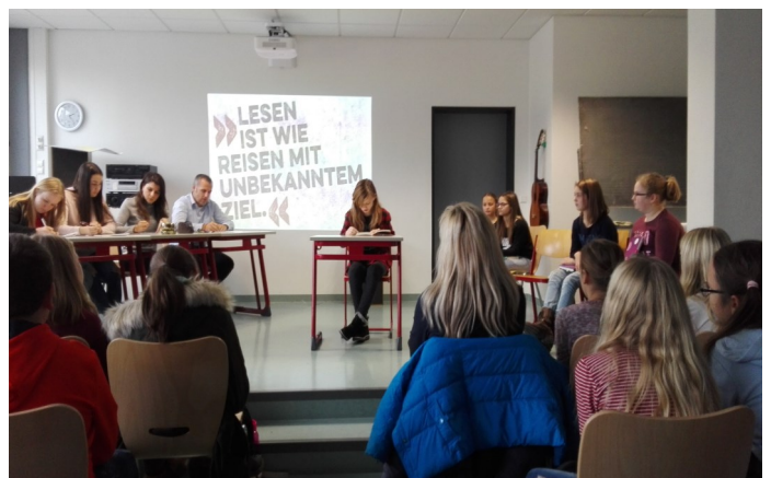
Das Bild zeigt die Jury mit der späteren Gewinnerin

Am Schluss hatte die Jury keine leichte Aufgabe zu bewältigen. Alle Vorleserinnen waren spitze.