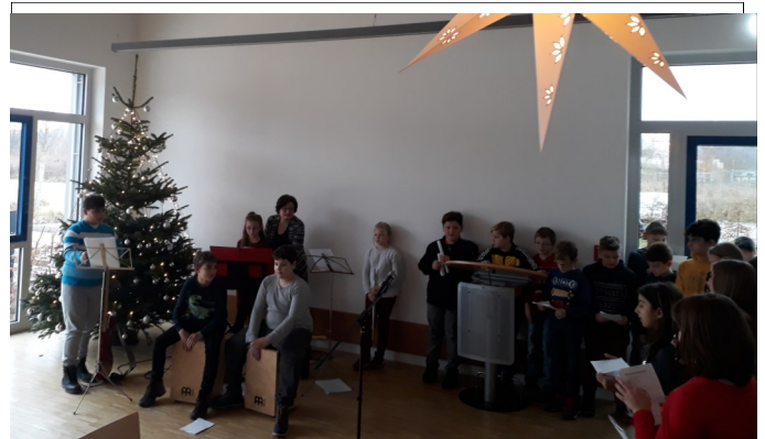
Bild vom gemeinsamen Singen und Musizieren