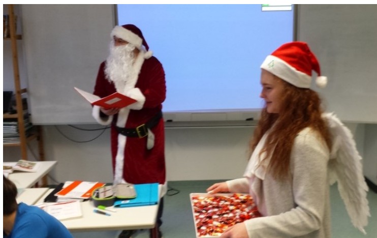
Der Weihnachtsmann mit seinem Engel

Lautes Klopfen war am 6.12. an so manchem Klassenzimmer unserer Robert-Bosch-Realschule zu hören, bevor dann ein Furchtloser die Tür öffnete. herein trat ein Weihnachtsmann, gefolgt von zwei Engeln und schließlich der gefürchtete Knecht Ruprecht mit seiner Rute.