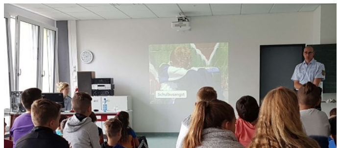
Bussicherheitstraining mit der Polizei

Sie dienen sowohl als Information über das Leistungsbild des einzelnen Schülers als auch der ganzen Klasse