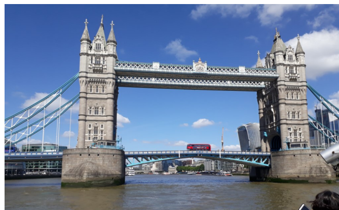
The Tower-Bridge of London

Alljährlich finden in den Klassenstufen verschiedene außerunterrichtliche Veranstaltungen statt. Die Klassen 6 fahren ins Schullandheim, die 8er nach England und die 10er werden zum Abschluss ihrer Zeit an der Robert-Bosch-Realschule eine Studienfahrt mit ihren Klassenlehrern durchführen.