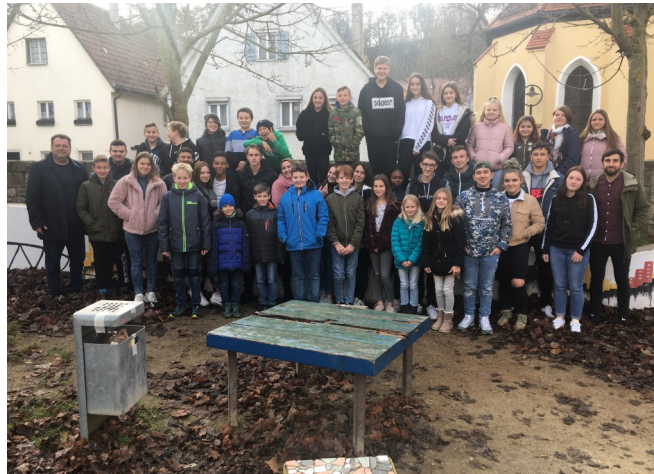
Gruppenbild vom SMV-Tag

Am 28.11.2019 fand der diesjährige SMV-Tag im Haus der Jugend statt. An diesem Tag haben die Klassensprecherinnen und Klassensprecher die Möglichkeit sich aktiv mit verschiedenen Themen rund um den Schulalltag auszutauschen. Der diesjährige Fokus lag dabei auf der Planung des 50-jährigen Schuljubiläums der Robert-Bosch Realschule, welches im nächsten Schuljahr stattfinden wird. In jahrgangsstufeninternen Gruppen wurden Ideen gesammelt, wie die SMV das Jubiläumsjahr aktiv mitgestalten kann. Die verschiedenen Ergebnisse wurden anschließend präsentiert und mit unserem Schul-