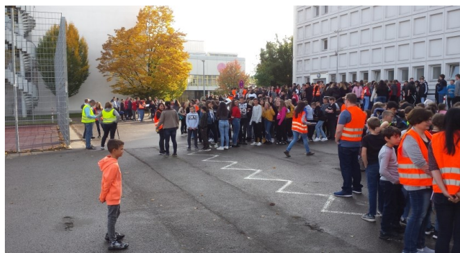
Das Bild zeigt die Klassen beim Samlungsort