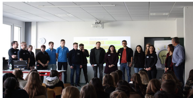
Ausbildungsbotschafter und Ausbildungsbotschafterinnen

„...ganz im Zeichen der Berufsorientierung“